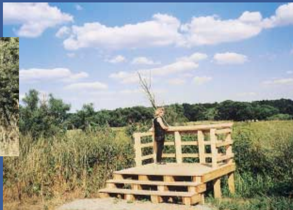
Ein Blick über die Altarme ist lohnenswert.

Nicht weit von Diderse liegt am rechten Okerufer der Ort Hillerse. Hier lohnt sich eine Besichtigung der Kapelle mit ihrem spätgotischen Schnitzaltar, die um 1500 erbaut wurde. Sehenswert ist ebenso die Modelleisenbahnschau des Modellbahnclubs Gifhorn-Hillerse.