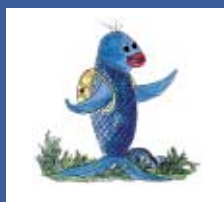
Das Maskottchen Blubby führt Sie durch den Naturerlebnispfad.

Den Gemeindemittelpunkt Meinersens bildet die sogenannte Traditionsinsel aus Rathaus, Künstlerhaus und der Okermühle. Weit über die Kreisgrenzen bekannt ist das “Weiße Gold”, der Meinerser Spargel.